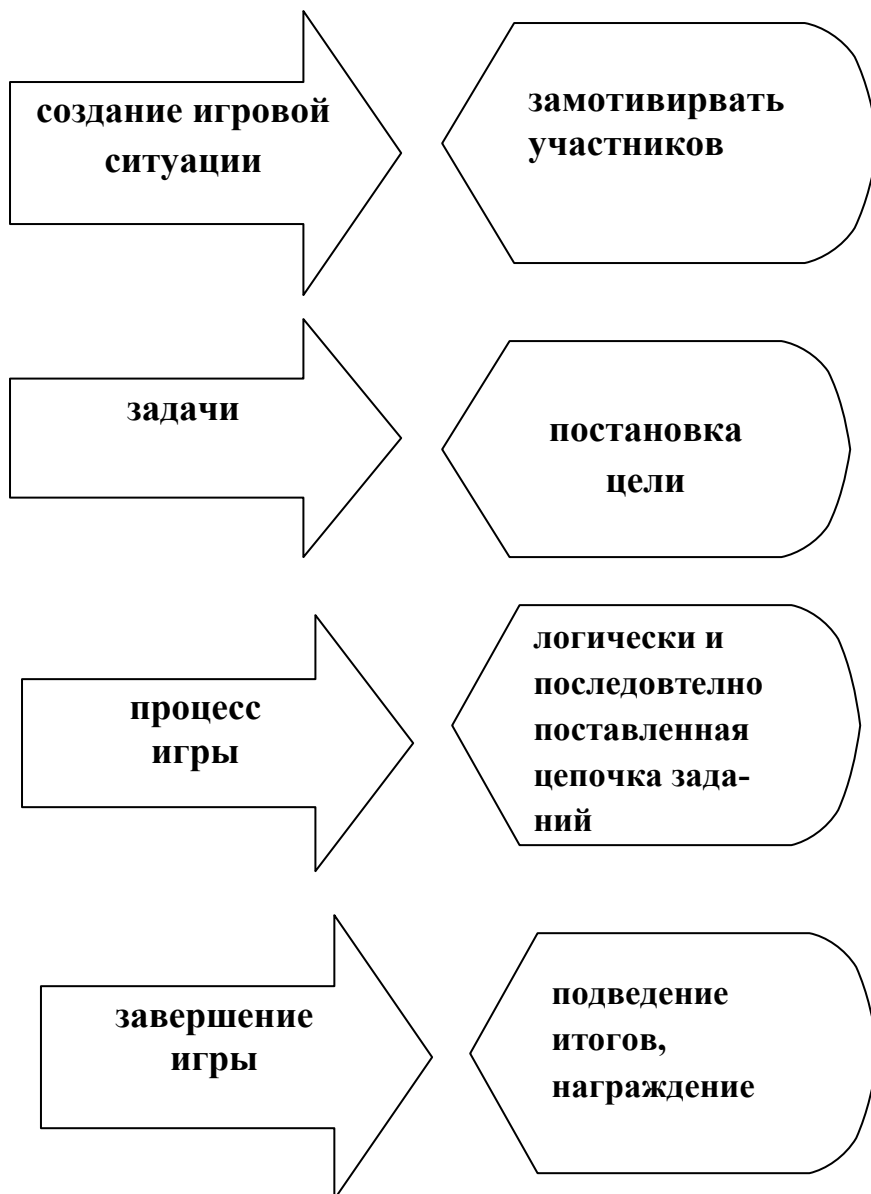
Схема проведения квест-игры